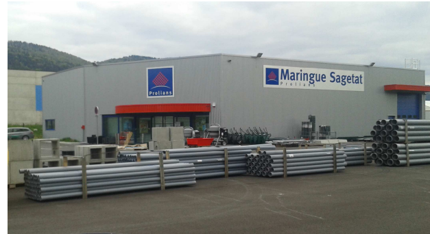
MARINGUE SAGETAT - Commerce de gros de quincaillerie Impasse des Peupliers