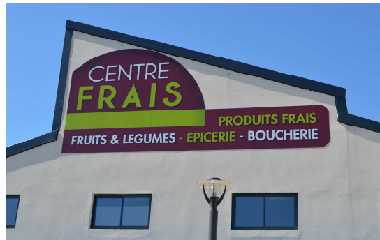
CENTRE FRAIS - Place des arcades