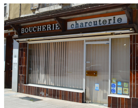
Boucherie LARCON - Place de l'hôtel de ville