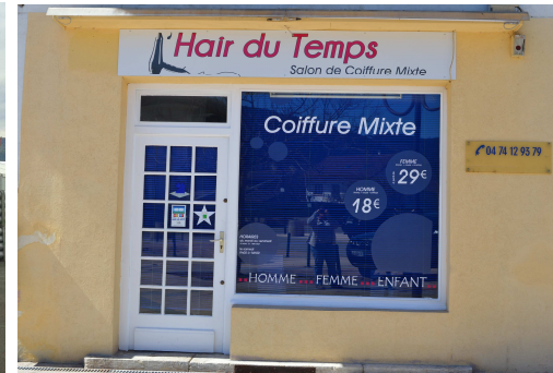
Nouvelle coiffeuse Place de l'hôtel de ville