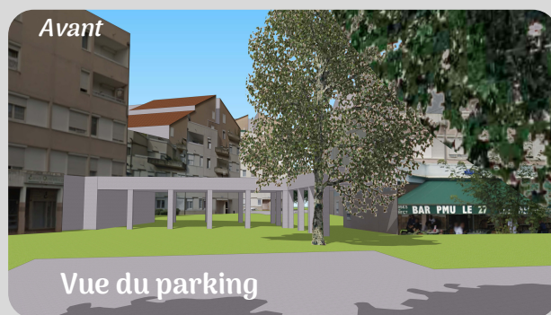
Vue du parking