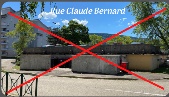
Rue Claude Bernard

Après la mise en place des aires "Vallès" et "Arcades", en début d'année, la ville et HBA vont installer 2 nouvelles aires :