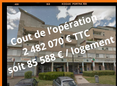
3 et 5 place des Arcades