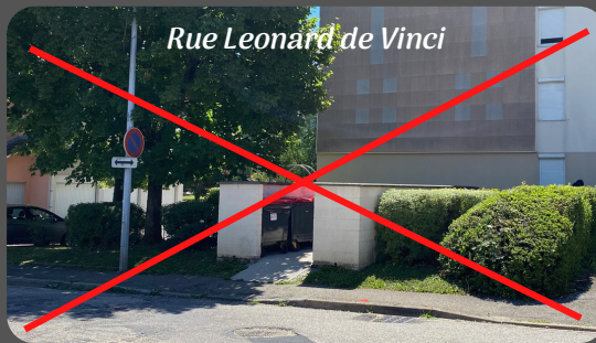
Rue Léonard de Vinci

L'heure de la disparition des poubelles et leurs espaces de regroupement a donc sonné !