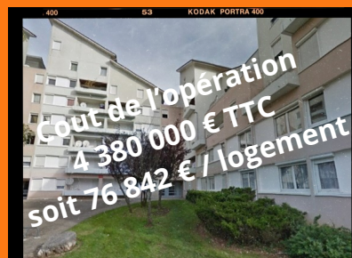
2 et 4 rue Claude Bernard 2 rue Louis Braille

Il est conseillé de ne pas entreprendre de travaux dans votre logement (peinture – tapisserie, etc..) qui pourraient être endommagé lors de la réhabilitation