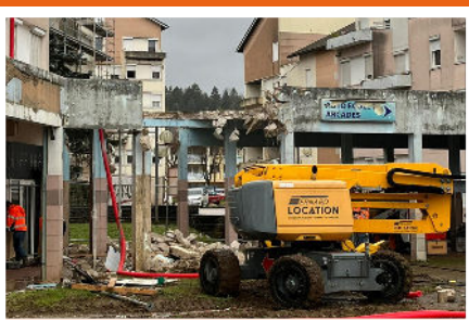
Début des travaux