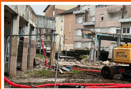
Pendant les travaux