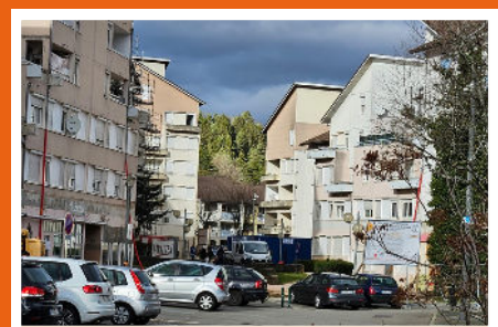
Fin des travaux