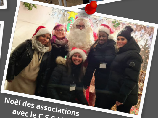
Noël des associations avec le C.S.C.J.P.